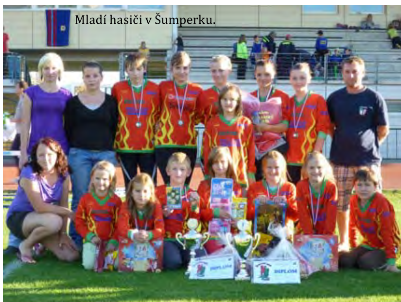
Mladí hasiči v Šumperku.

V pátek 19.8.2011 v 19,54 hodin obdrželi členové výjezdní jednotky formou SMS od velícího důstojníka z operačního střediska ve Zlíně pokyn k výjezdu jednotky k vyvrácenému stromu po bouři na cyklotrase u mostu do Jarcové. Po příjezdu bylo zjištěno, že přes celou cestu leží větrem vyvrácená vrba. Po jejím rozřezání a uvolnění cesty jednotka zjistila, že přilehlou cyklotraou ohrožují další tři odnože vrby, jejichž stabilitu vyvrácený strom narušil. Protože se stmívalo a ponechat stromy narušené by znamenalo riziko pro chodce i cyklisty, bylo rozhodnuto o použití elektrocentrály a osvětlovací soupravy a o skácení zbylých ohrožujících stromů. Celý zásah si vyžádal cca 2,5 hodiny. Bohužel, než si majitel stihl zajistit odvoz svého majetku (palivového dřeva), neznámý poberta jej předběhl a dřevo si přivlastnil.