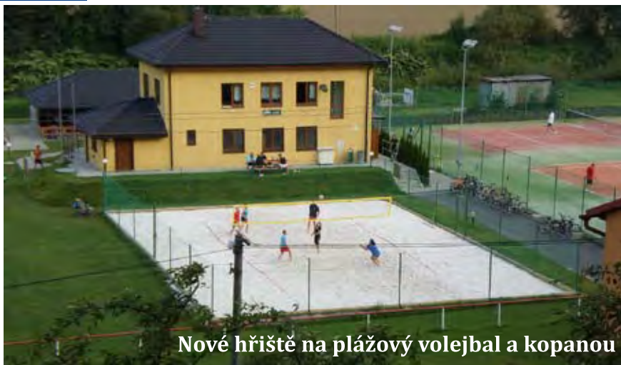
Nové hřiště na plážový volejbal a kopanou

V průběhu letošního roku bylo stávající sportoviště rozšířeno o travnatou tréninkovou plochu pro kopanou a běžecké disciplíny požárního sportu. Tato plocha byla vybudována z pole za kurty. Dále jsme postavili hřiště na plážový volejbal a plážovou kopanou. Toto plážové hřiště kvůli snaze postavit jej co nejlevněji bylo vybudováno svépomocí a tímto krokem nás oproti stavbě „na klíč“ hřiště stálo zhruba třetinu. Navýstavbě se finančně podílela obec 80% a TJ Sokol Jarcová 20%. Bylo dovezeno 140 tun křemičitého písku z lomu ve Střelči u Jičína, který je na trhu v ČR nejvhodnější pro toto využití. Hřiště bylo kompletně včetně oplocení a vchodové branky dobudováno v druhé polovině prázdnin a hned po otevření bylo hojně využíváno pro plážový volejbal jak místními občany, tak přespolními sportovci.