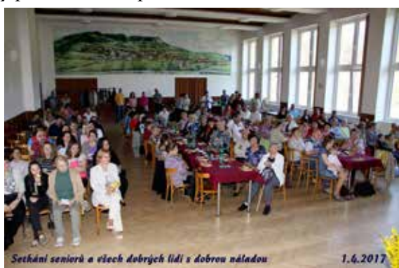
Setkání seniorů a všech dobrých lidí s dobrou náladou