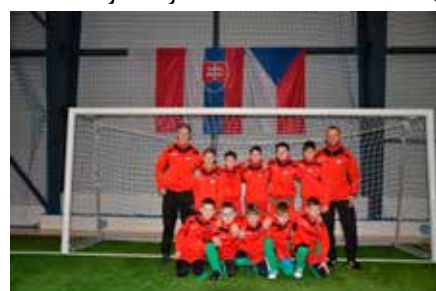
Tým přípravek na turnaji v Korní