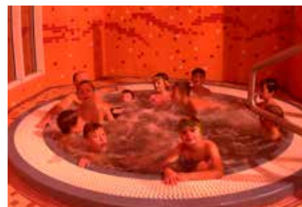
Relaxace ve vířivce

Za členy Výkonného výboru TJ Sokol Jarcová