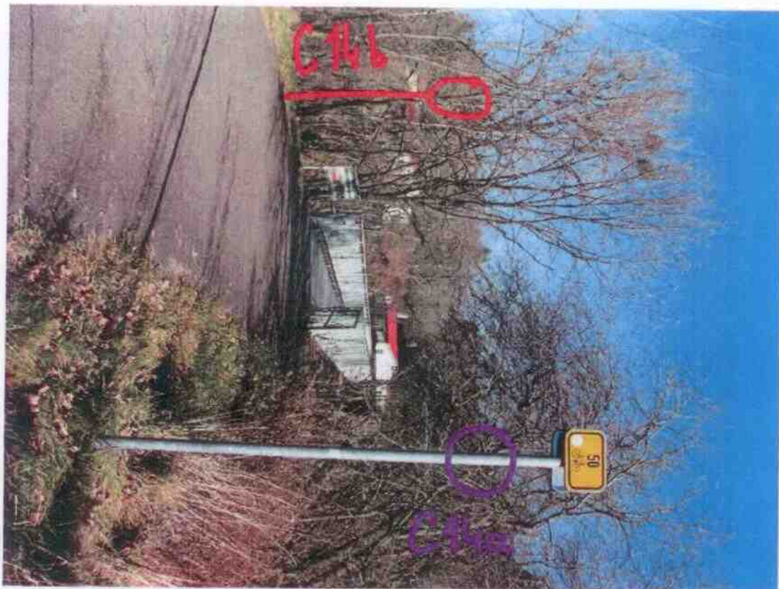
Příloha č.1b - Lávka č.1 – U přejezdu