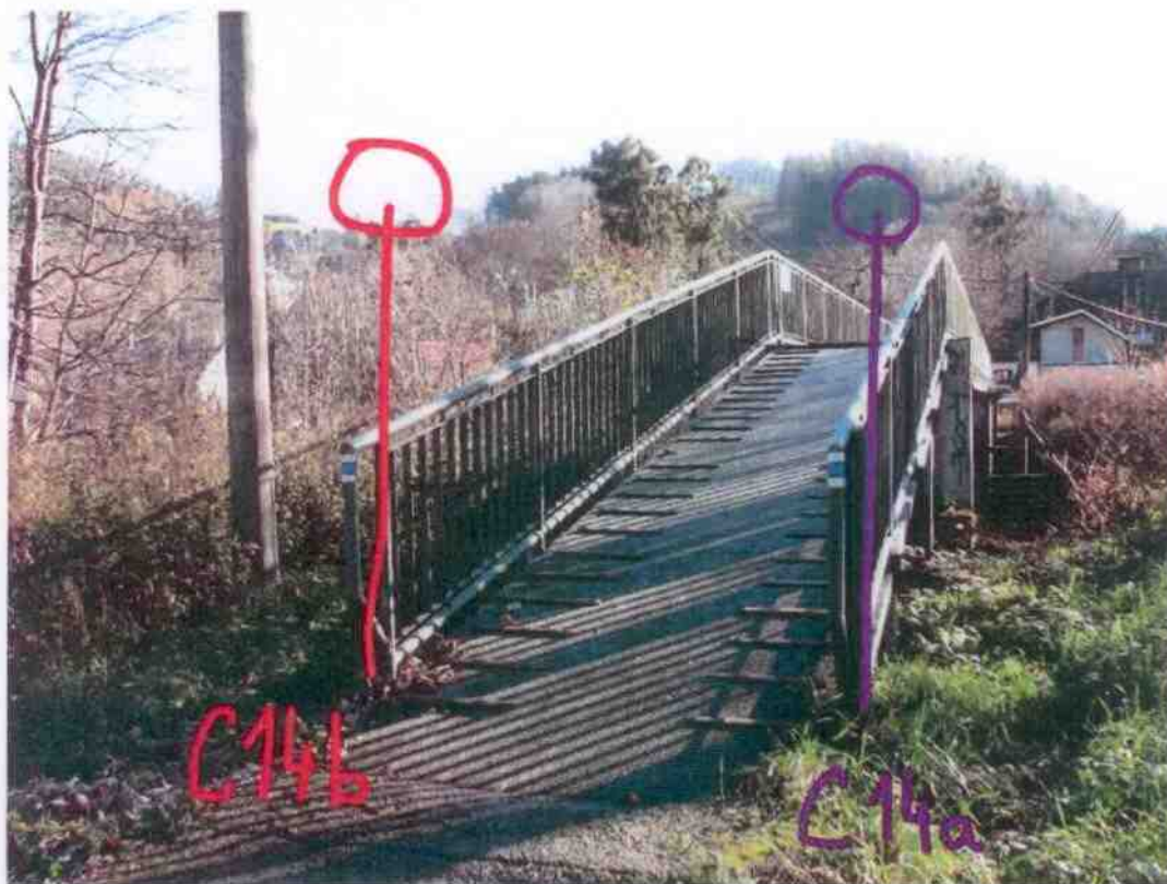
Příloha č.2b - Lávka č.2 – U pizzerie

Městský úřad Odbor dopravně správních agend Valašské Meziříčí -3- PŘÍLOHA č. 4 K č.j.: MEURH/140538/2021 DORUČENO 23. 11. 2021